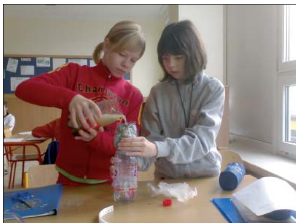
Pitná voda z kohoutku má rozhodně jinou barvu.

Na druhém stupni se objevily projekty jako například Svět pod vodou – skuteč-