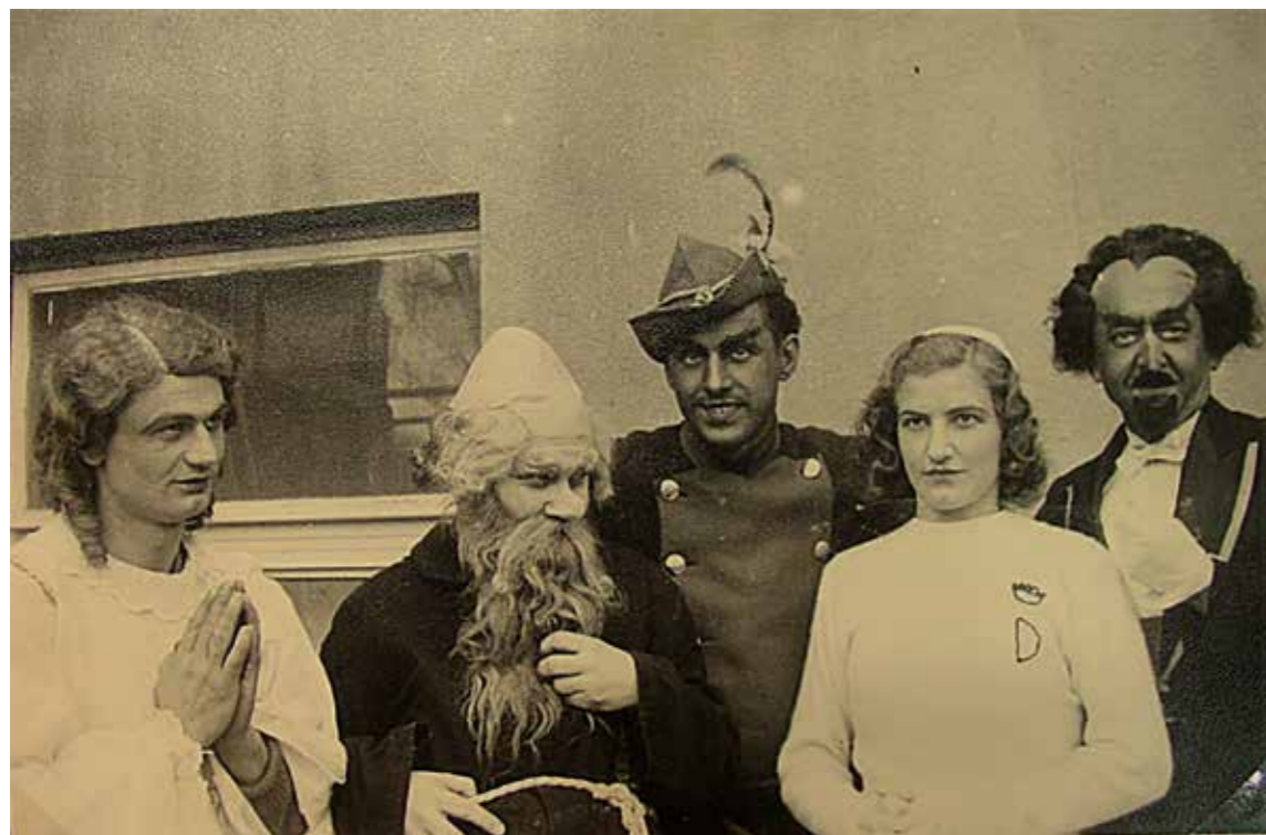
Divadelní soubor Sokola, J. Drda „Hrátky s čertem“