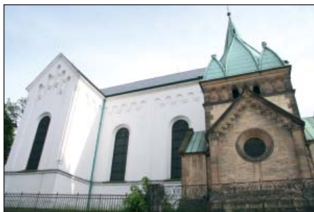
Kostel sv. Remigia