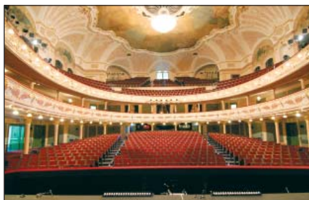
Hudební divadlo Karlín