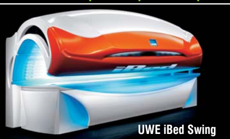
UWE iBed Swing