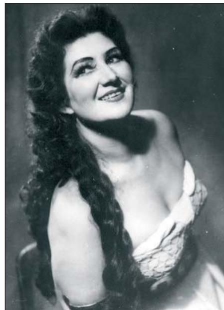
Marie Podvalová jako Fibichova Šárka