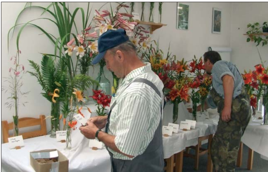
Květy lilií omámily nejen ženy, ale i mnohé muže.

Od 30. srpna bude linka 140 opět vedena ulicí Oderskou.