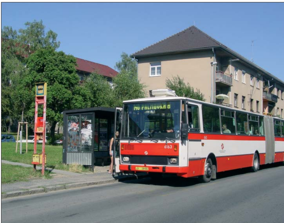
Linka číslo 140 je jedna z mála, na které nedošlo ke změnám trasy v jízdním řádu.

Je jasné, že každá změna někoho potěší a někomu se naopak cestování zhorší. Domnívám se, že změny v září většinu