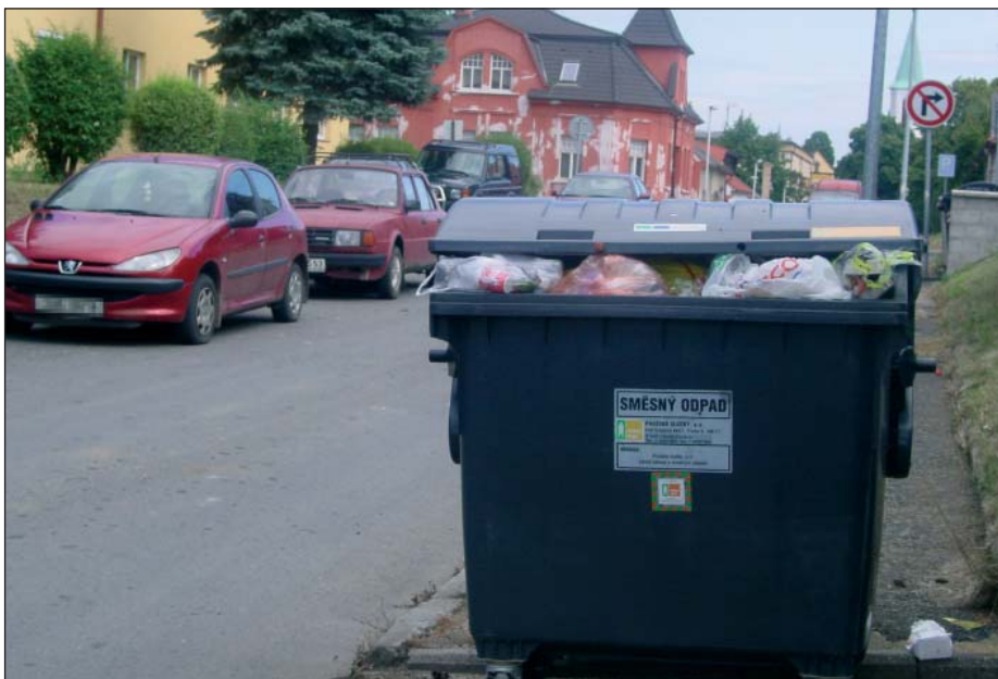
Takový obrázek už by se nám na území hlavního města neměl naskytnout.

Na území hl. m. Prahy zajišťují svoz komunálního odpadu svozové společnosti zapojené do systému města – Pražské služby, a. s., IPODEC – Čisté město, a. s., AVE CZ