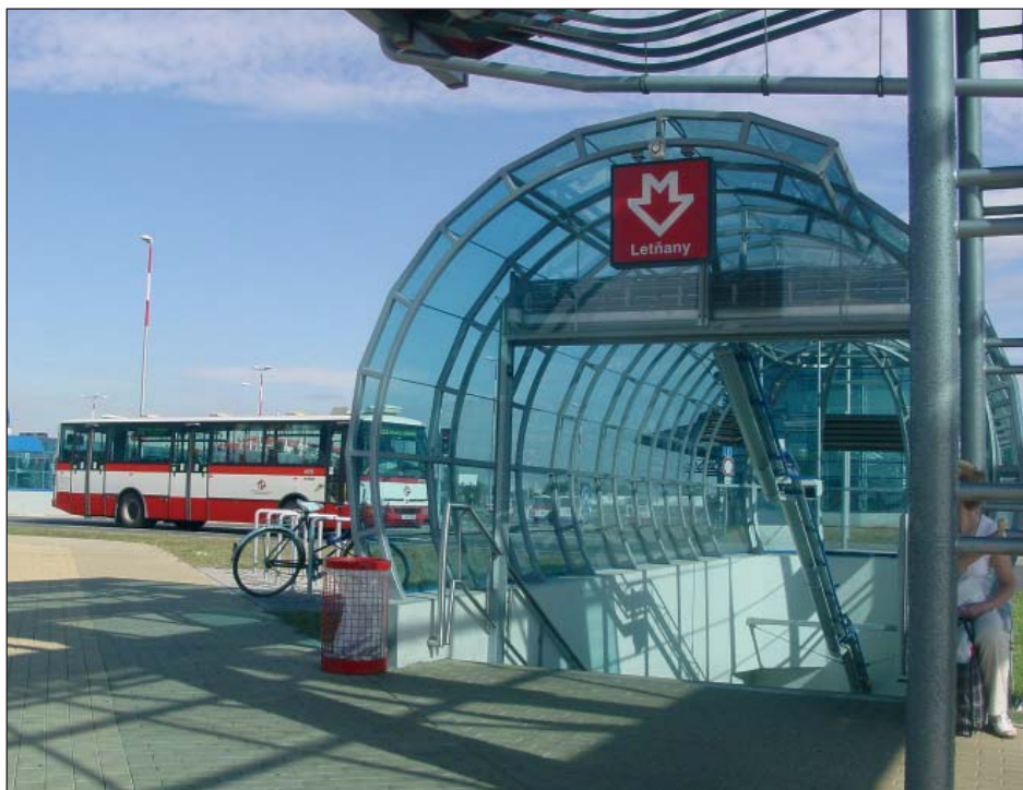
V letošním roce poprvé došlo k zásadním změnám v jízdních řádech v souvislosti s otevřením nové stanice metra v Letňanech. Stejně jako v jiných začátcích, i zde se projeví první nedostatky, a tak po čtyřech měsících provozu dochází k další úpravě jízdního řádu.