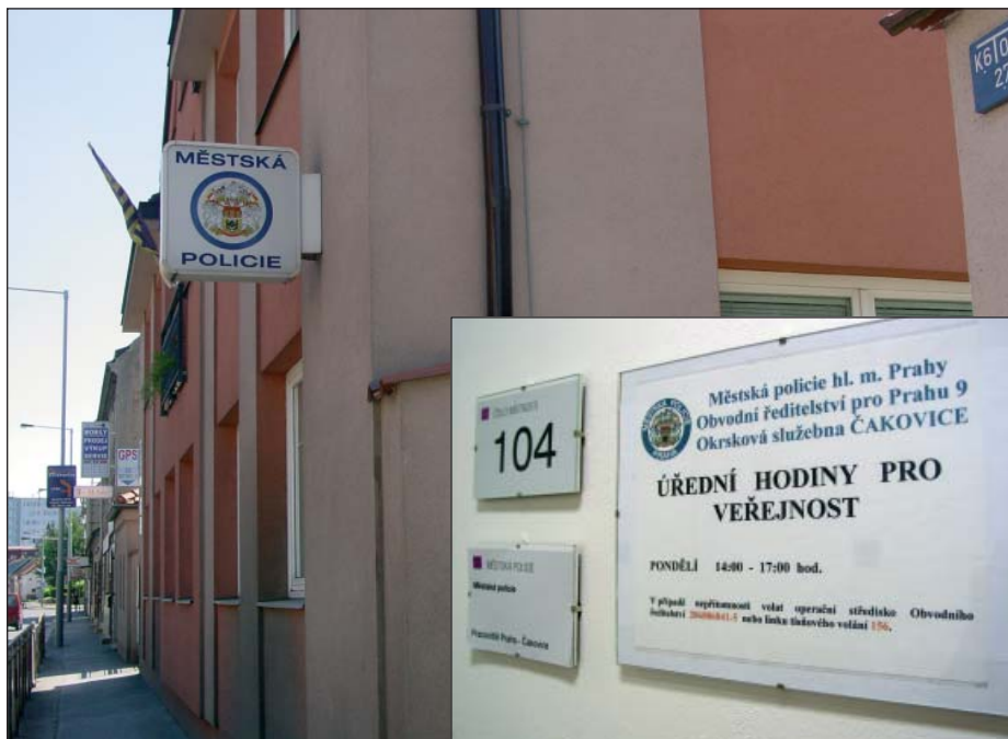
Nyní zastihnete strážníky na služebně více méně jen v pondělí.