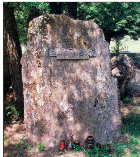
Pomník Václava Babinského umístěný na hřbitově v Praze - Řepích.

Sraz účastníků vycházky je v 9.15 hod. na konečné autobusů. Odjezd bude autobusem č. 140 směr metro Palmovka.