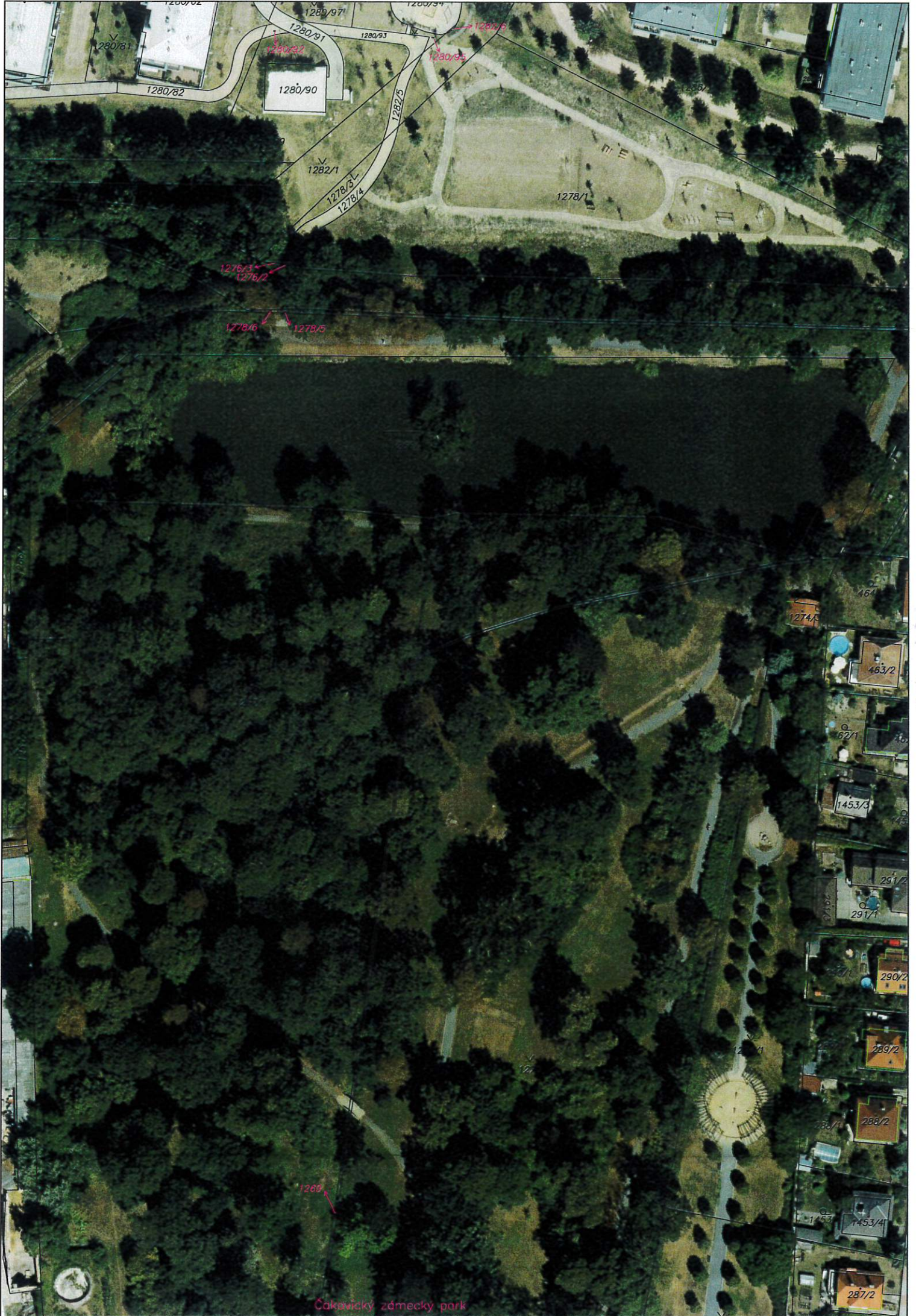
Čakovický zámecký park