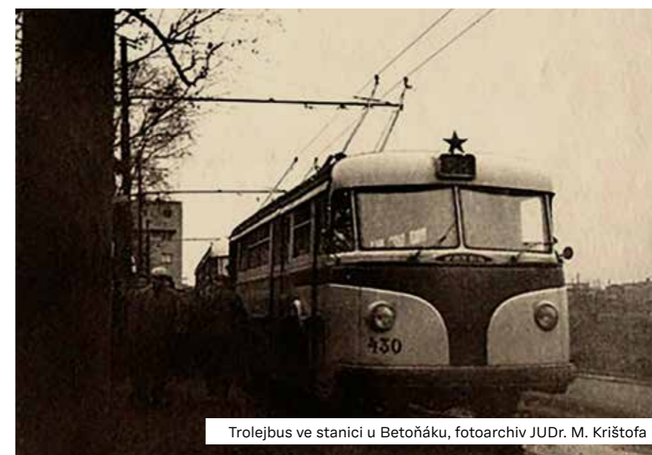
Trolejbus ve stanici u Betoňáku