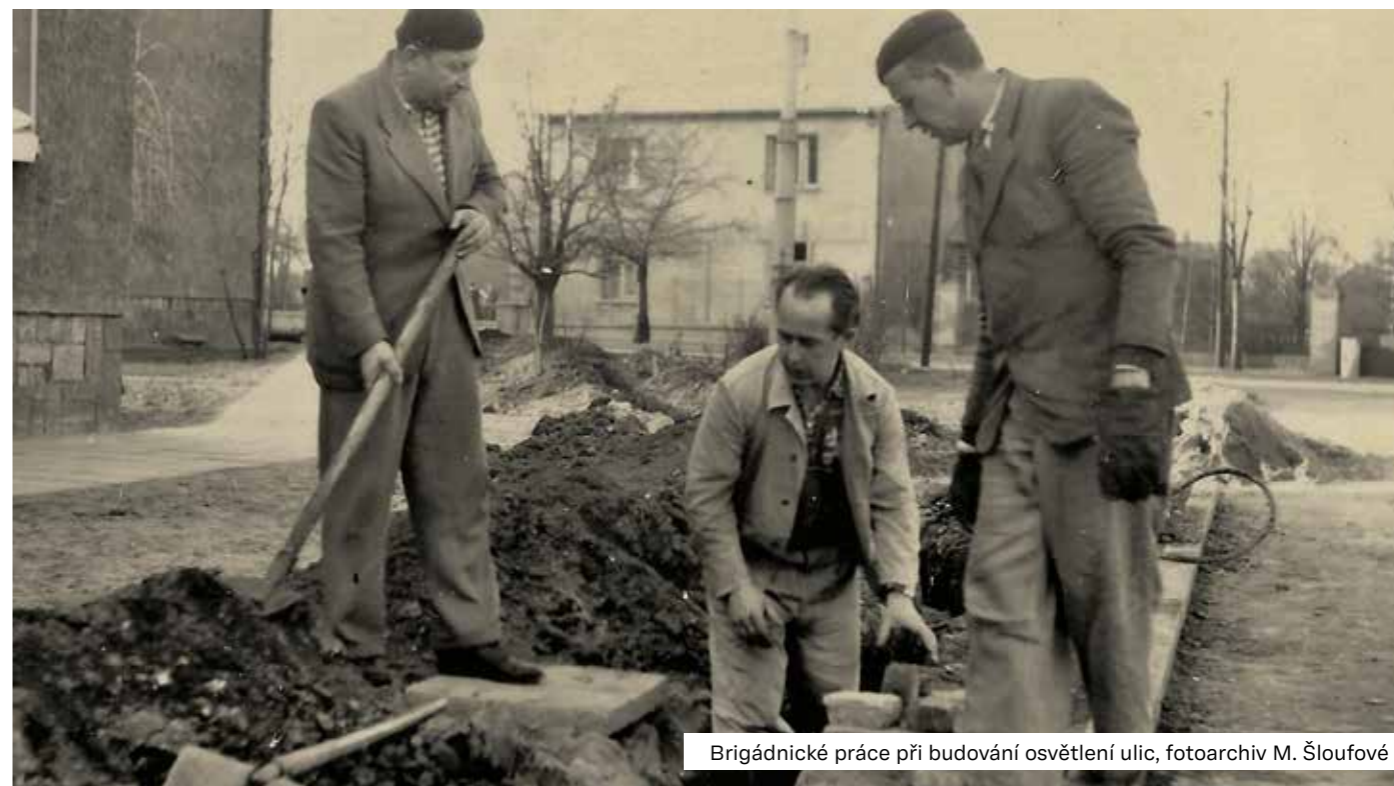
Brigádnické práce při budování osvětlení ulic

Komunální podnik má 23 provozoven, které poskytují služby v těchto oborech: zahradnictví, pedikúra, sklenářství, klempířství, truhlářství, malířství, sběrna šatstva, oděvní tvorba, autoopravna,