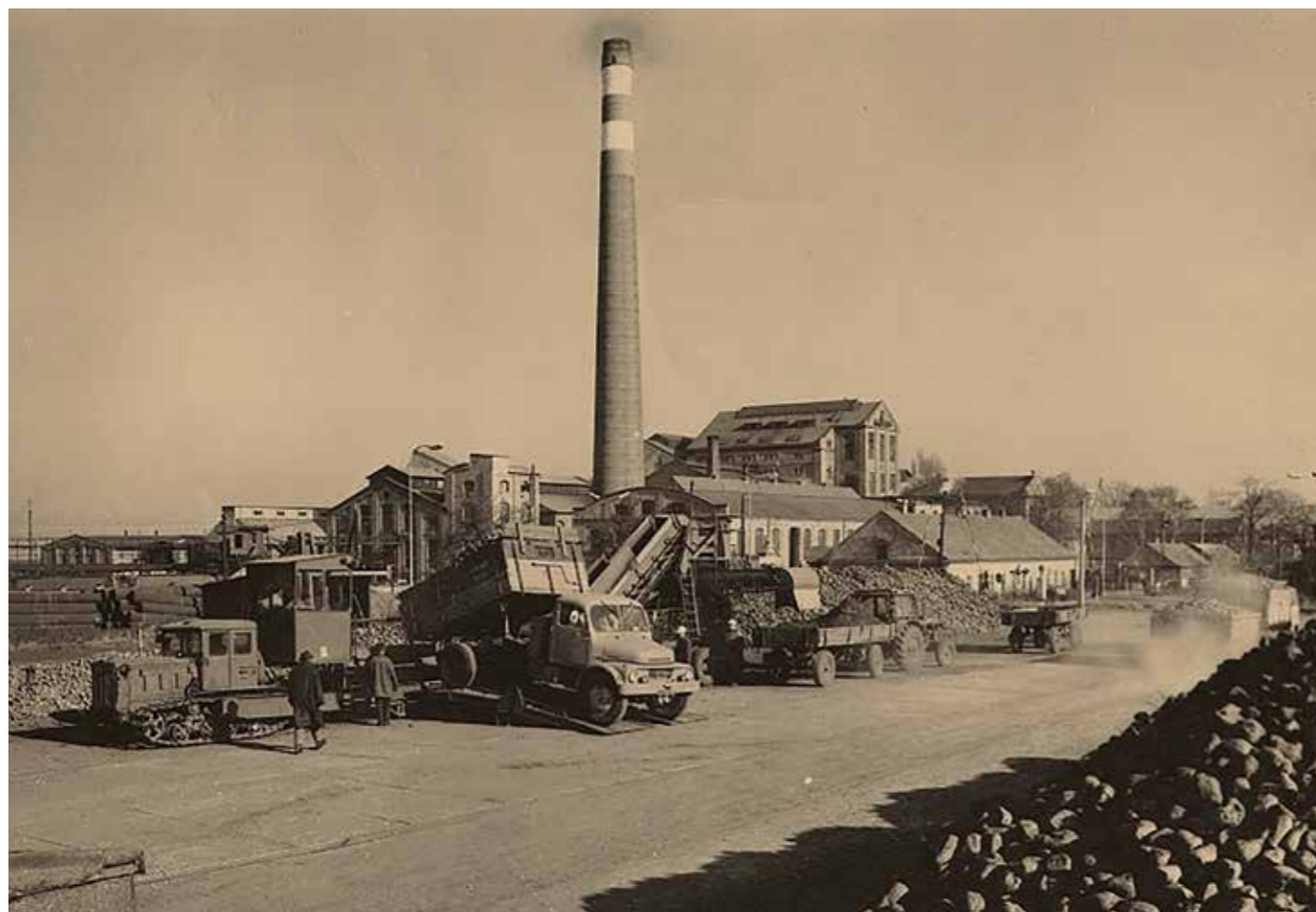
Cukrovar v době kampaně