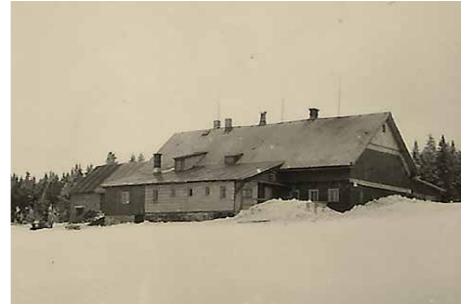
Prvosenka, podniková rekreační chata Veltechny Čakovice