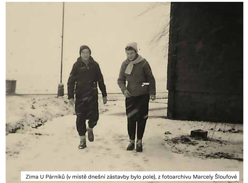
Zima U Párníků (v místě dnešní zástavby bylo pole)