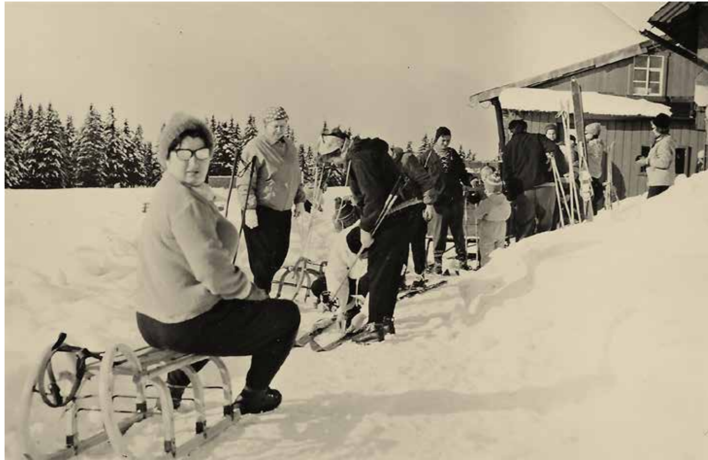
Zaměstnanci na podnikové rekreaci Veltechny (ZPA Čakovice), chata Prvosenka pod Liščí horou