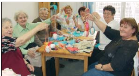
Letos si návštěvníci klubu seniorů vyzkoušeli zajímavou techniku zdobení velikonočních vajec, patchwork