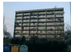
Pískovcova před nástavbou