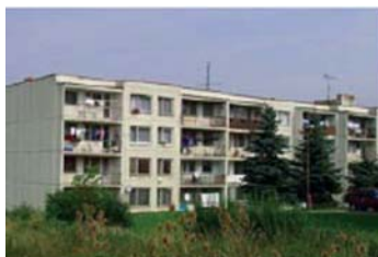
Hostivice před nástavbou