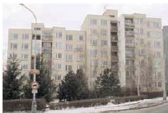
Cíglarova před nástavbou