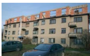
Řež před nástavbou