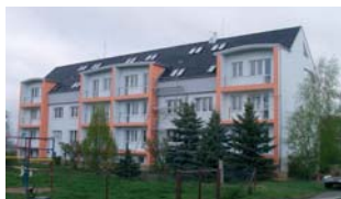
Horoměřice II. etapa