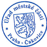
Ing. Milena Pekařová (osvědčení dle § 12 zák. č. 491/2001 Sb.)

Proti tomuto rozhodnutí se může volební strana, která podala kandidátní listinu, do 2 pracovních dnů od jeho doručení domáhat ochrany u Městského soudu v Praze (ust. § 59 odst. 2 zákona o volbách); za doručené se toto rozhodnutí považuje třetím dnem ode dne jeho vyvěšení na úřední desce registračního úřadu (ust. § 23 odst. 4 zákona o volbách).