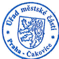
Ing. Milena Pekařová (osvědčení dle § 12 zák. č. 491/2001 Sb.)

Proti tomuto rozhodnutí se může volební strana, která podala kandidátní listinu, do 2 pracovních dnů od jeho doručení domáhat ochrany u Městského soudu v Praze (ust. § 59 odst. 2 zákona o volbách); za doručení se toto rozhodnutí považuje třetím dnem ode dne jeho vyvěšení na úřední desce registračního úřadu (ust. § 23 odst. 4 zákona o volbách).