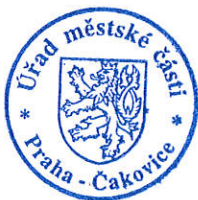
Ing. Milena Pekařová (osvědčení dle § 12 zák. č. 491/2001 Sb.)

Proti tomuto rozhodnutí se může volební strana, která podala kandidátní listinu, do 2 pracovních dnů od jeho doručení domáhat ochrany u Městského soudu v Praze (ust. § 59 odst. 2 zákona o volbách); za doručení se toto rozhodnutí považuje třetím dnem ode dne jeho vyvěšení na úřední desce registračního úřadu (ust. § 23 odst. 4 zákona o volbách).