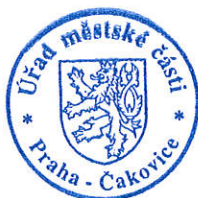
Ing. Milena Pekařová (osvědčení dle § 12 zák. č. 491/2001 Sb.)

Proti tomuto rozhodnutí se může volební strana, která podala kandidátní listinu, do 2 pracovních dnů od jeho doručení domáhat ochrany u Městského soudu v Praze (ust. §59 odst. 2 zákona o volbách); za doručené se toto rozhodnutí považuje třetím dnem ode dne jeho vyvěšení na úřední desce registračního úřadu (ust. § 23 odst. 4 zákona o volbách).