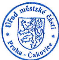
Ing. Milena Pekařová (osvědčení dle § 12 zák. č. 491/2001 Sb.)

Proti tomuto rozhodnutí se může volební strana, která podala kandidátní listinu, do 2 pracovních dnů od jeho doručení domáhat ochrany u Městského soudu v Praze (ust. §59 odst. 2 zákona o volbách); za doručené se toto rozhodnutí považuje třetím dnem ode dne jeho vyvěšení na úřední desce registračního úřadu (ust. § 23 odst. 4 zákona o volbách).