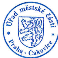
Ing. Milena Pekařová (osvědčení dle § 12 zák. č. 491/2001 Sb.)

Proti tomuto rozhodnutí se může volební strana, která podala kandidátní listinu, do 2 pracovních dnů od jeho doručení domáhat ochrany u Městského soudu v Praze (ust. § 59 odst. 2 zákona o volbách); za doručené se toto rozhodnutí považuje třetím dnem ode dne jeho vyvěšení na úřední desce registračního úřadu (ust. § 23 odst. 4 zákona o volbách).