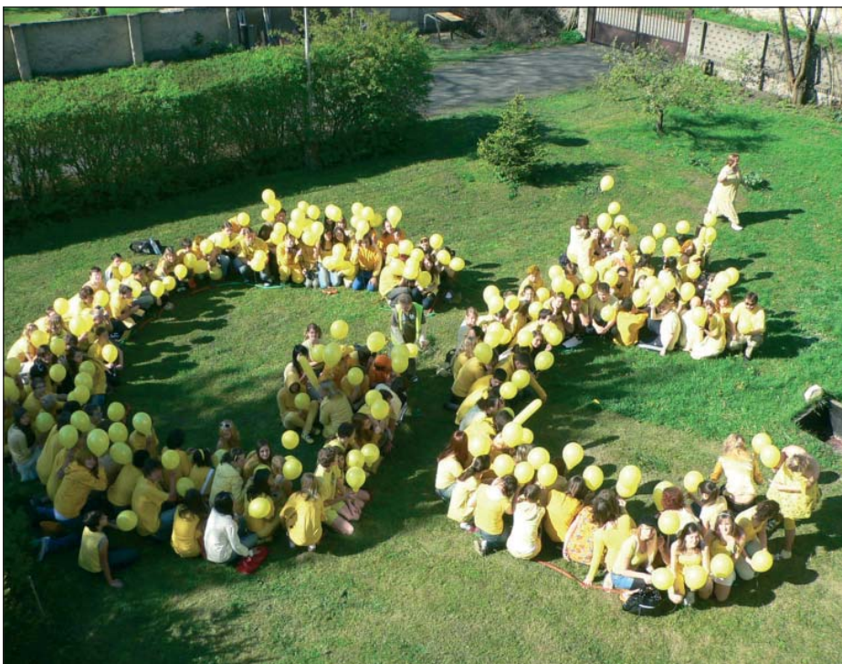
Na zahradě školy vytvořili gymnazisté znak školy ze svých těl a na počest svátku Země vypustili žluté balonky.