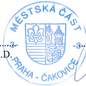
Bc. Blanka Klimešová zástupce starosty