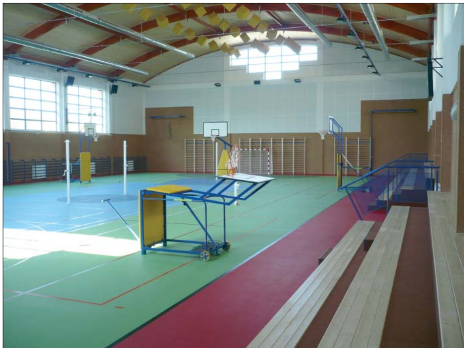
Přijďte se sami na vlastní oči přesvědčit, jak vypadá interiér nové tělocvičny.