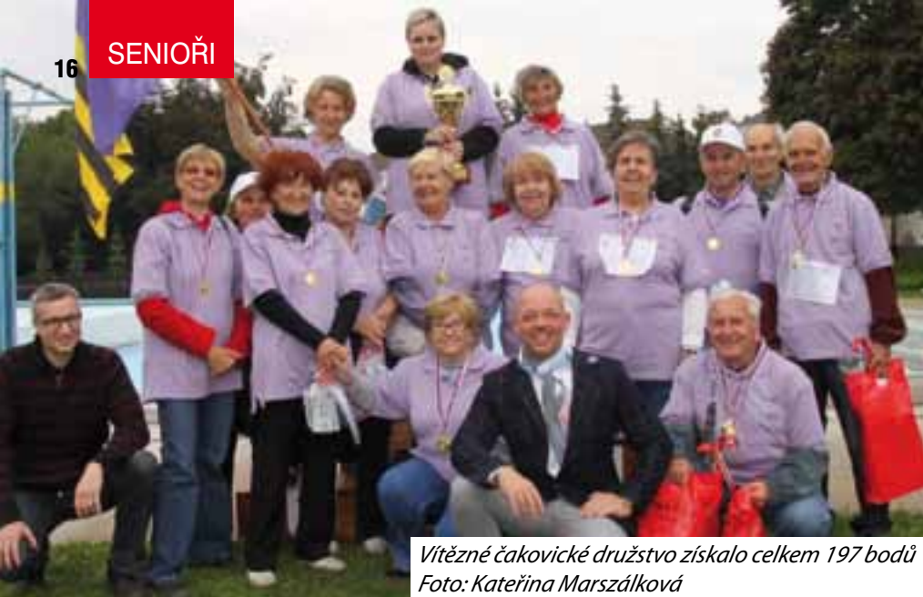
Vítězné čakovické družstvo získalo celkem 197 bodů