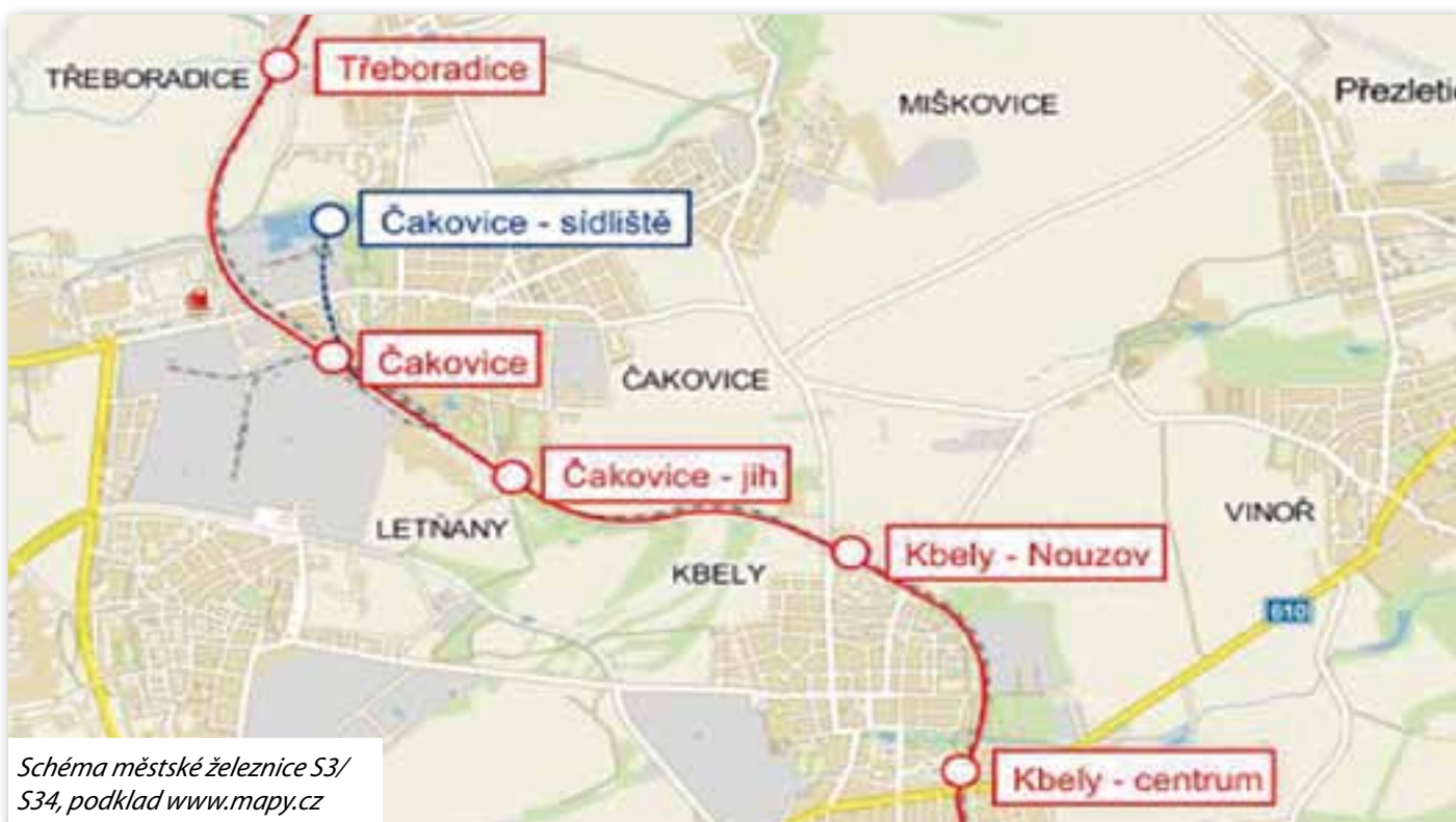
Schéma městské železnice S3/S34