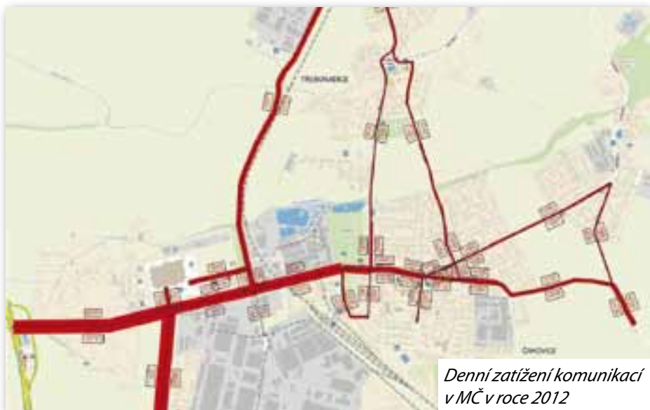
Denní zatížení komunikací v MČ v roce 2012