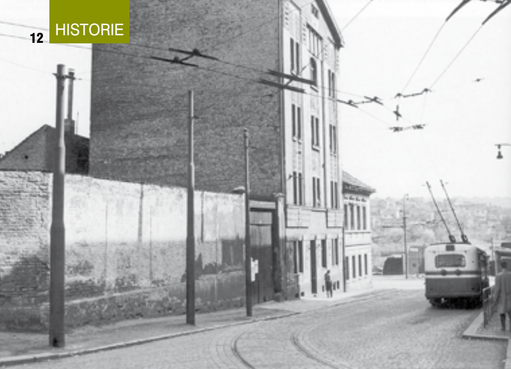
Smyčka trolejbusu č. 58 U Kříže