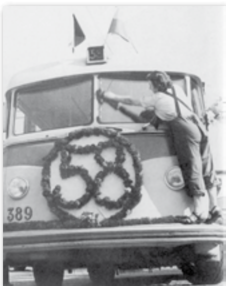
Trolejbusy byly součástí pražské dopravy do roku 1972

stavbu tratí byly vyčísleny na 793 milionů Kčs. Během roku 1992 však byly veškeré přípravy na stavbu zastaveny.