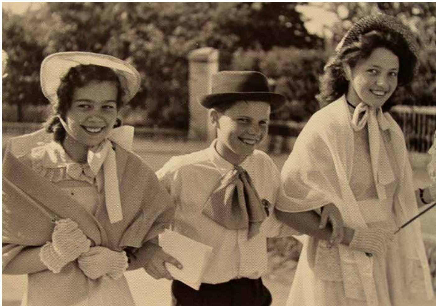
Studentský majáles gymnázia Čakovice v zámeckém parku, 1959.