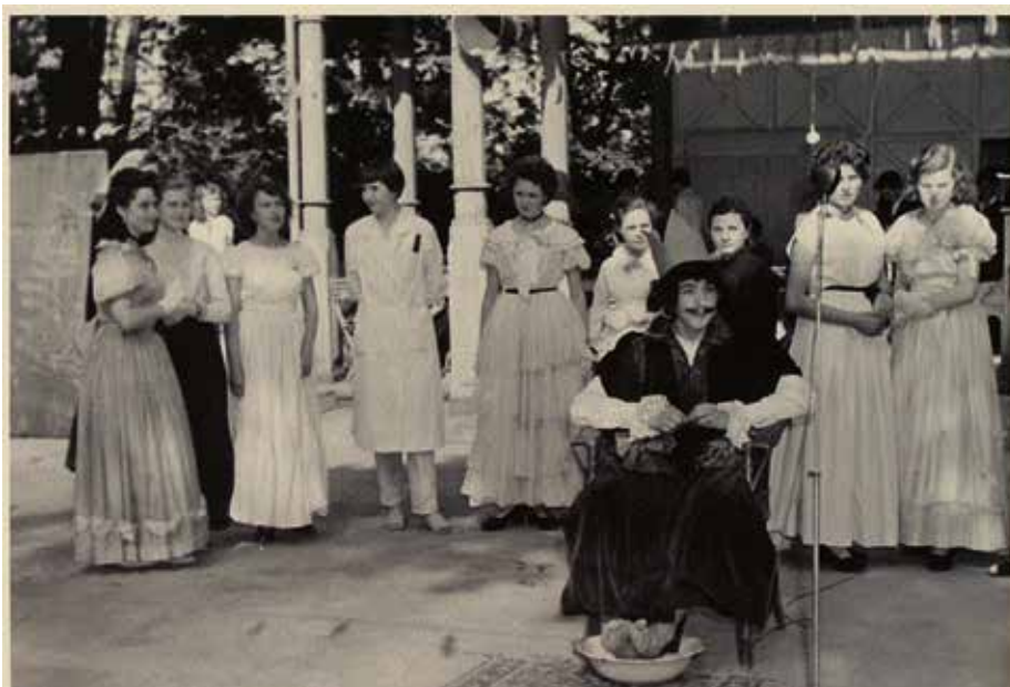
Studentský majáles gymnázia Čakovice 1959.

Jedenáctiletá střední škola rozšířila počet tříd, žáků i učitelů. Ve školním roce 1958/1959 byla nově zřízena 9. třída základního vzdělání. Celkem má škola 30 tříd se 1101 žákem. Na národní škole je 18 učitelů, většinou žen. Ředitelem školy je K. Masák, zástupci M. Martínková a J. Mašín. Jako každým rokem odešla řada učitelů a nastoupili noví mladí: Novotná, Konečná, Mašín, Svašková, Štěpanovská. MNV dal šesti učitelům i dekrety na krásné byty v bytových jednotkách. Jako školníci pracují ve třech budovách: