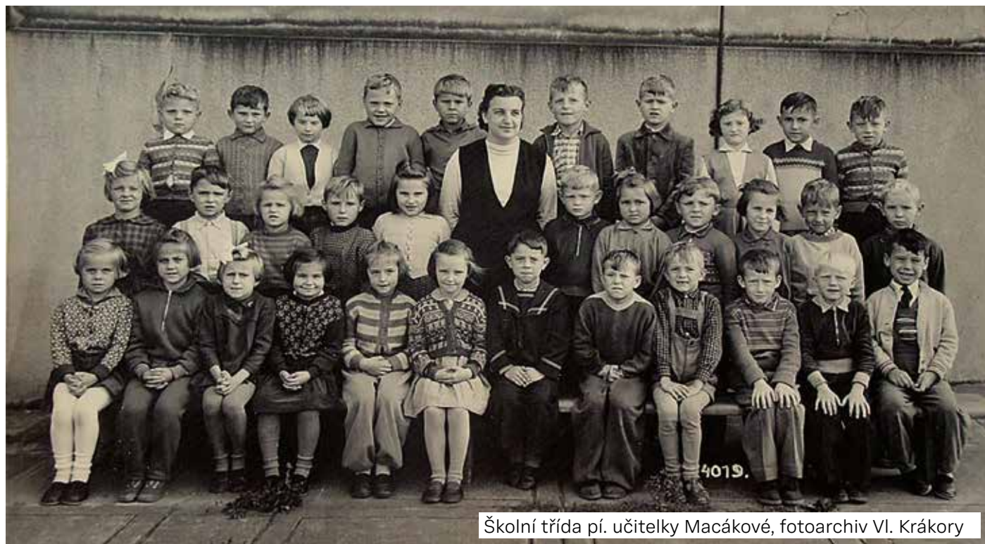
Školní třída pí. učitelky Macákové