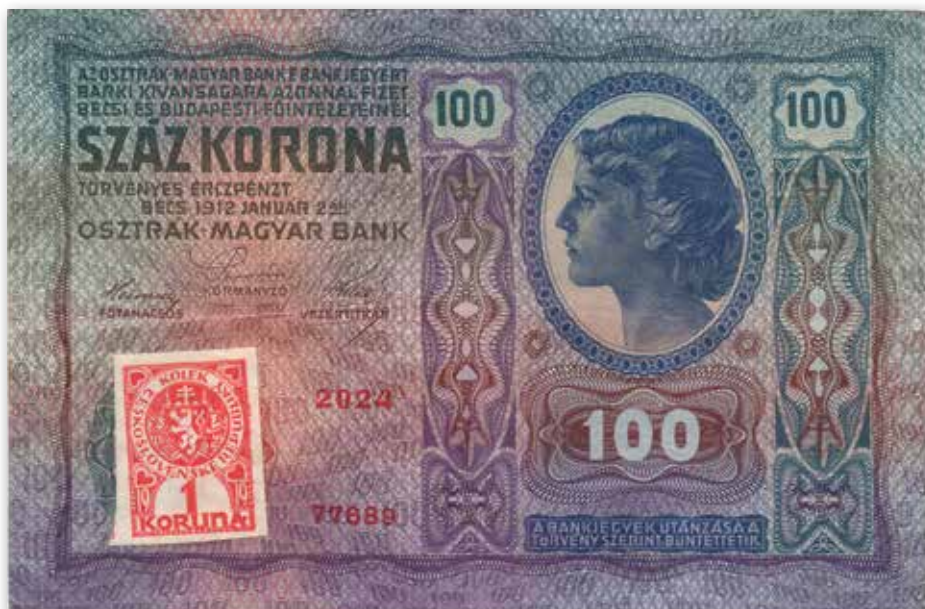
Bankovky opatřené československými kolkky r. 1919 na základě peněžní reformy A. Rašína.

Generál a ministr Dr. Milan Stefanik při návratu z Itálie do vlasti zabil se blíže Bratislavy při pádu aeroplánu. Tento hrdina a jeden z tvůrců naší republiky a samostatnosti je celým národem československým oplakáván. Prvá smlouva o míru byla odevzdána ve Versailles. Německo a Rakousko jsou přinuceny uznati naše hranice. Polsku musí Německo postoupiti Horní Slezsko, Poznaňsko a Gdaňsko, Francie dostane Alsas a Lotrinsko. Německo zaplatí válečnou náhradu 100 miliard, bude odzbrojeno a zřekne se zámořských osad. Sídlem svazu národů