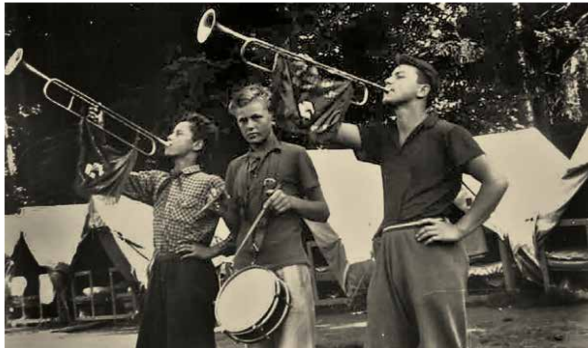
Táborový budíček ve Varvažově (asi 60. léta)