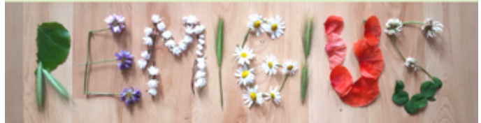
Foto pošlete na email: kancelar@farnostcakovice.cz, do předmětu napište "Výtvarná soutěž". V textu zprávy uveďte jméno, příjmení, kategorii ("dospělý" nebo "dítě") a u dětí také věk.

Vytvořte z přírodnin či libovolných jiných materiálů dle fantazie Vaše jméno a zašlete nám foto do 20. 9. 2020. Fotografie vystavíme na farním webu, ty nejpovedenější odměníme.