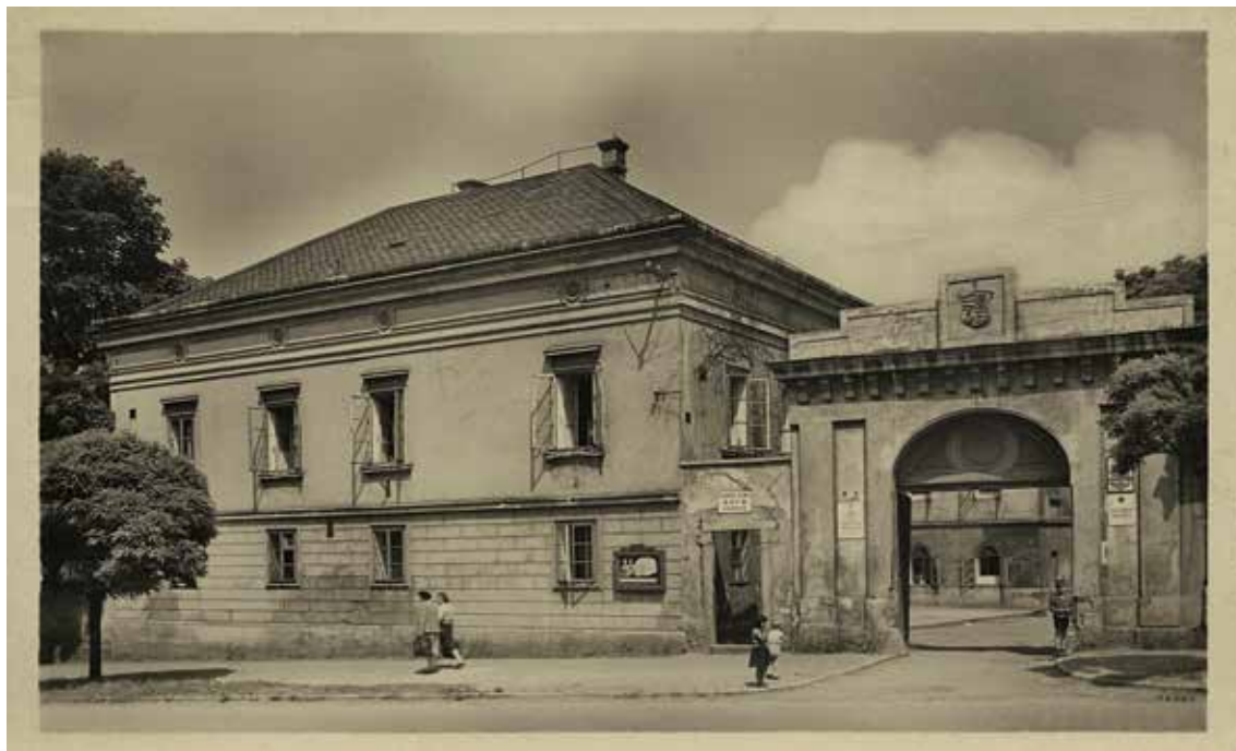
Čakovický zámek v roce 1946, archiv kroniky