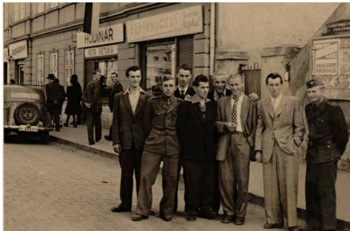
Na hlavní ulici