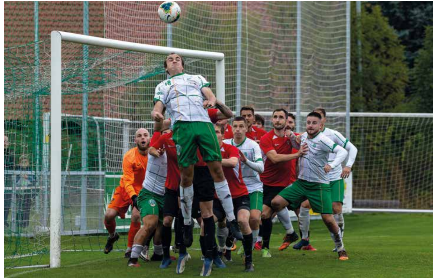
podzimní šlágr Dolní Chabry - Třeboradice skončil nerozhodně 1:1