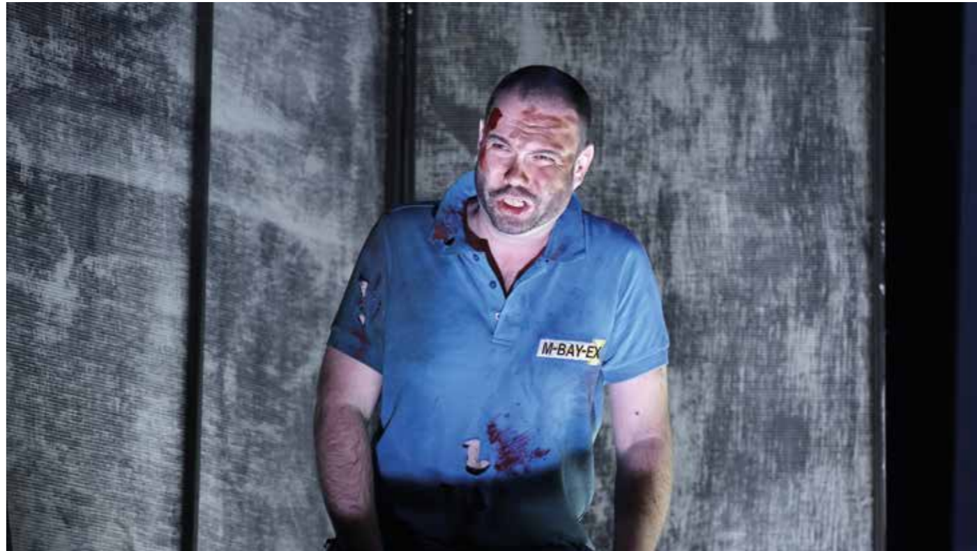
Válka s mlóky