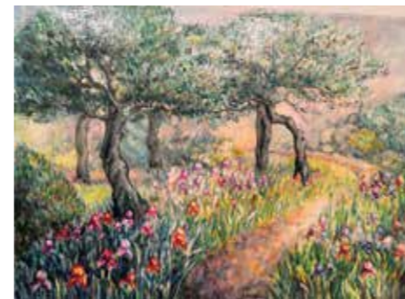
Autor: akademická malířka Mgr. Jana Anděličová