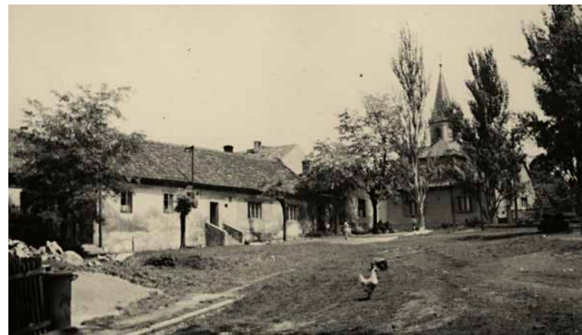
Stará návěs v Čakovících