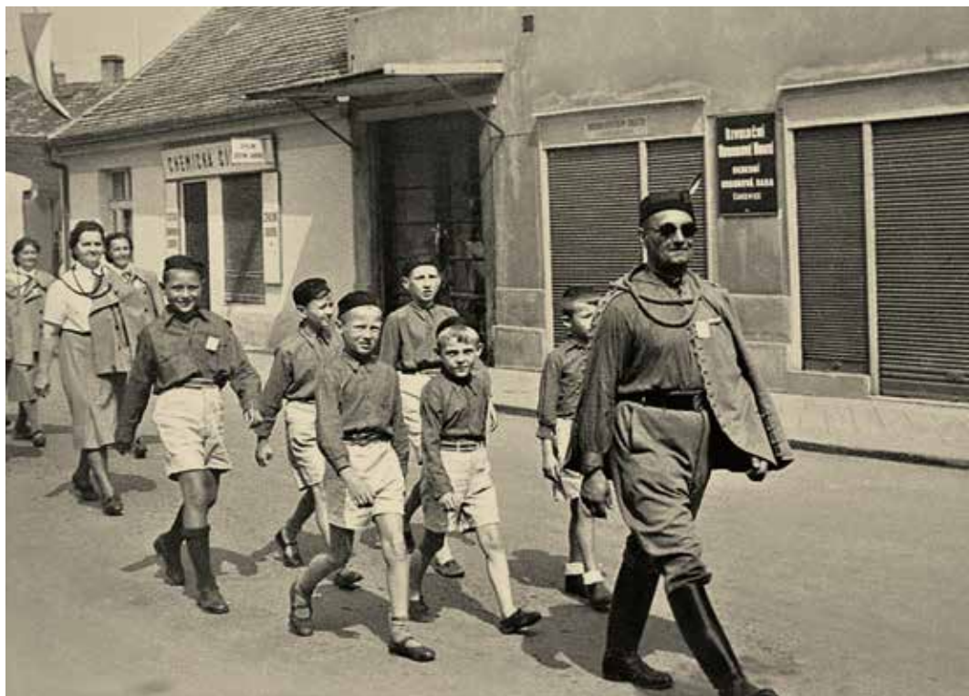
Slavnostní pochod Sokolů Čakovice

„Naše věc není pro strany, ale pro národ veškerý.“ (Tyrš) Tímto heslem řídili se Sokolové, avšak jejich samotná dokonalá organizovanost a kázeň vzbuzovala respekt a nevoli některých politických režimů. Jak se na vlnách historie houpal Sokol Čakovice?