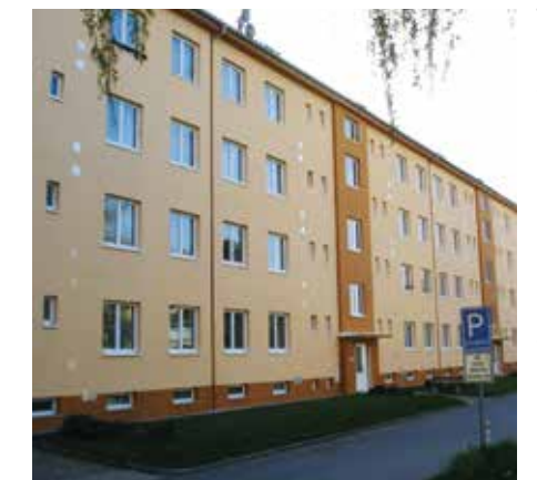
Foto: Ilustrační-předpoklad změny bytových domů po jejich revitalizaci