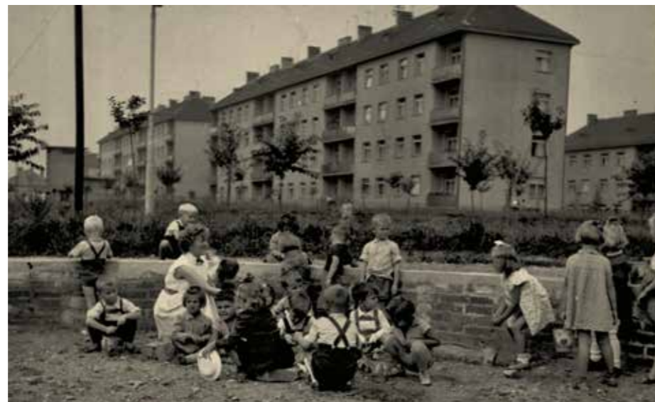
Foto: Děti na sídlišti Avia

převzal do své správy 7 provozoven komunálních služeb: zahradnictví, holičství a kadeřnictví, pohřební službu, sklenářství, chemickou čistírnu a truhlářství. Při osvětlové besedě pracuje divadelní soubor s 20 členy. Knihovna je otevřena ka-