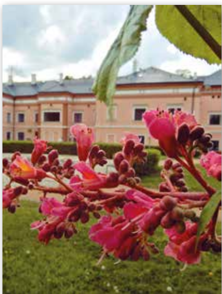
2. místo - Nikola Špačková, Čakovický zámek