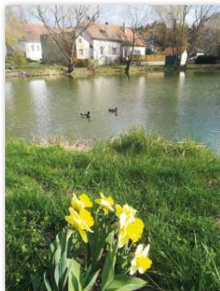
Čestné uznání - Olga Klimecká, Miškovice