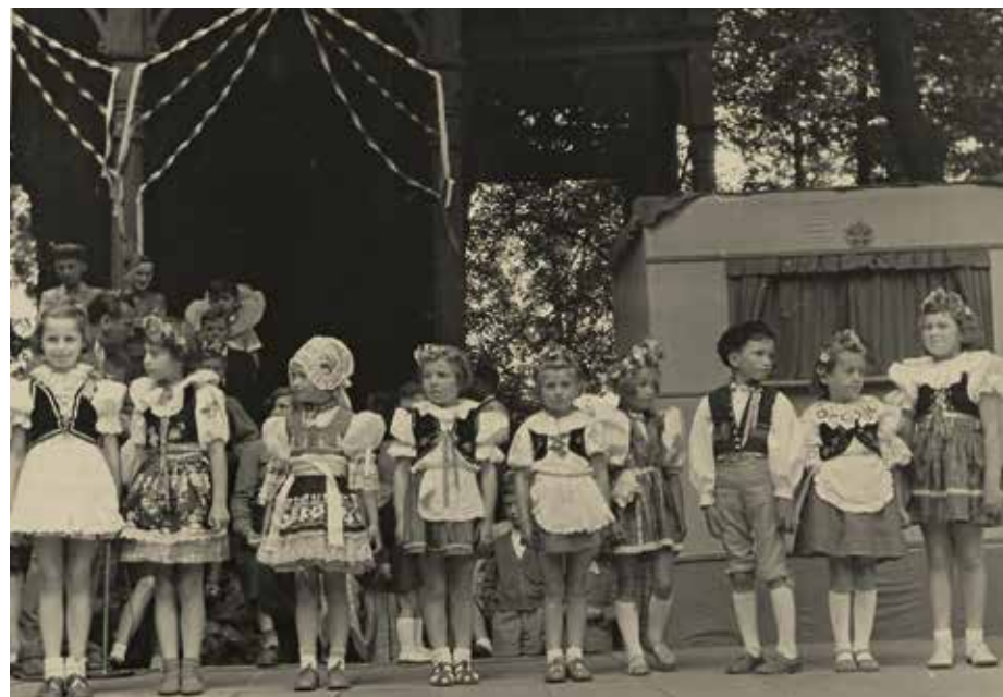
Foto: Soutěž o nejhezčí kroj v rámci celookresních dožínků u altánu v parku, fotoarchiv Marušky Černé.