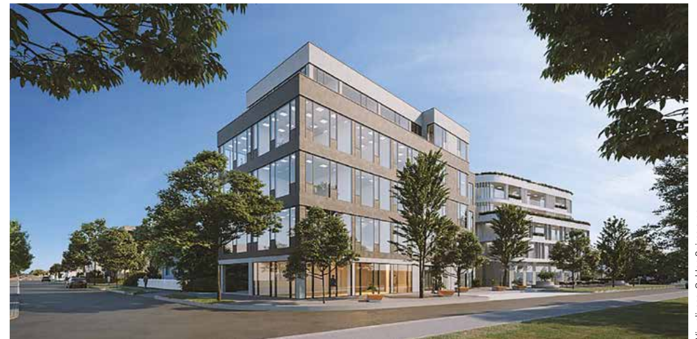
Vizuálizace: Golden Spires, s.r.o.