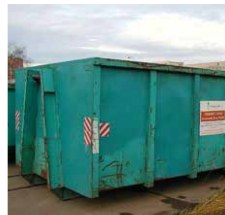
U nás v Čakovicích /// www.cakovice.cz

Třeboradice – parkoviště u hřbitova 1 ks Miškovice – Na Kačence 1 ks