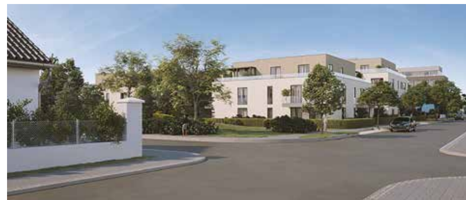
Vizualizace: Golden Spires, s.r.o.

V projektu je plánována výstavba nové komunikace, aby se předešlo přetíženosti stávajících komunikací. U pláno-