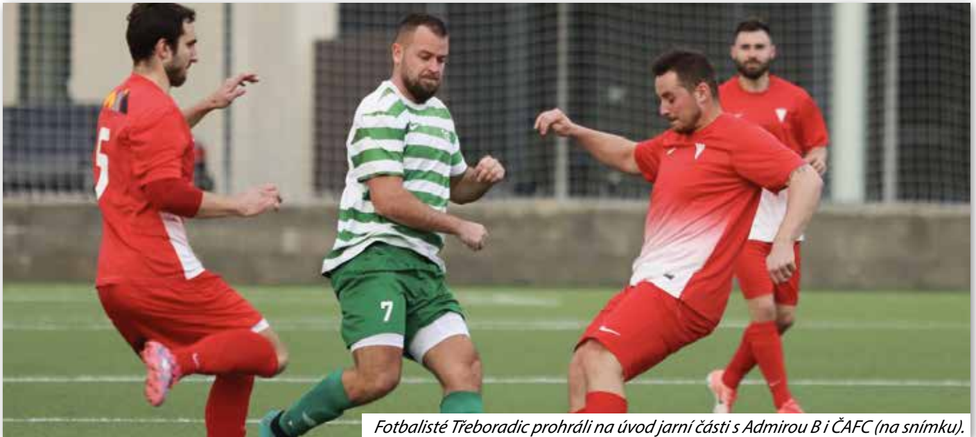
Fotbalisté Třeboradice prohráli na úvod jarní části s Admirou B i ČAFC (na snímku).