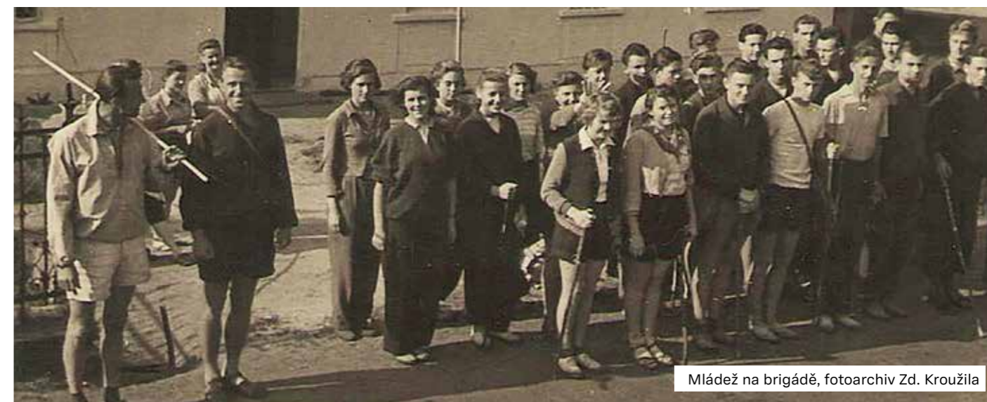
Mládež na brigádě

Z kronikářských zápisů Františka Mlejnska