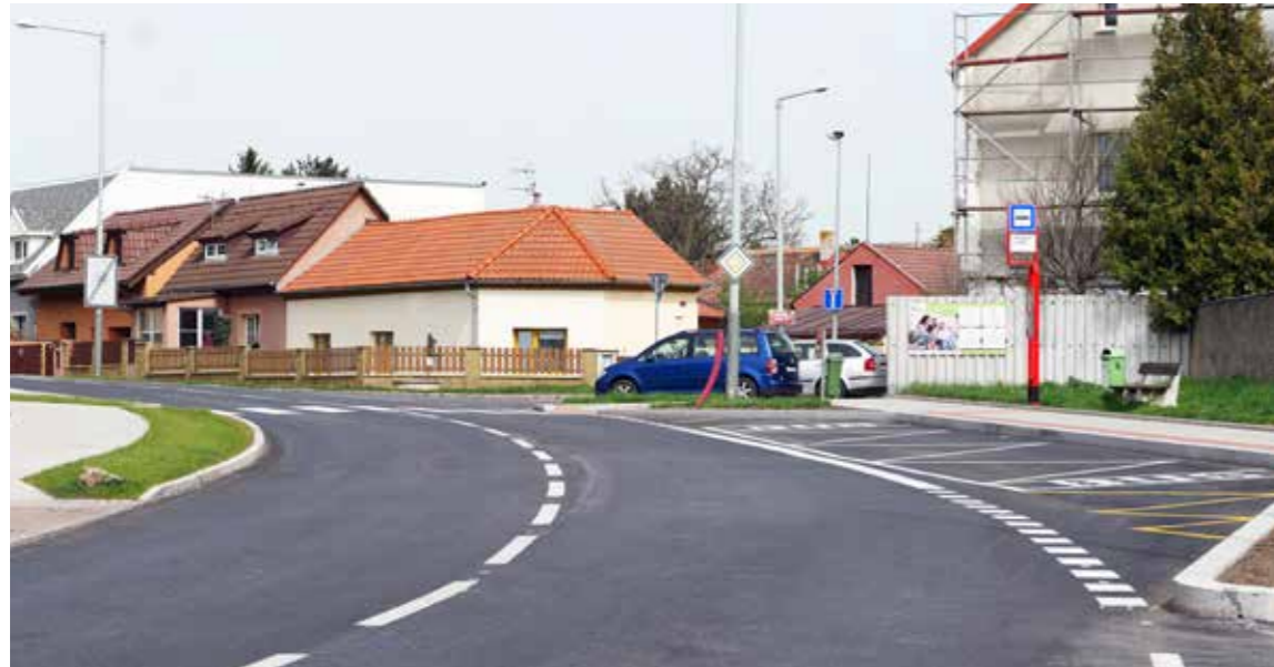
Foto: Komunikace Schoellerova po rekonstrukci – Michaela Šimůnková

Na svých pravidelných zasedáních Rada městské části Praha-Čakovice projednala několik bodů jednání. Vybíráme pro vás některé z nich.