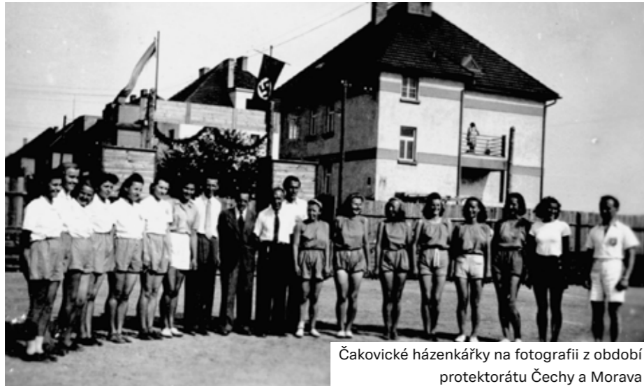
Čakovické házenkářky na fotografii z období protektorátu Čechy a Morava