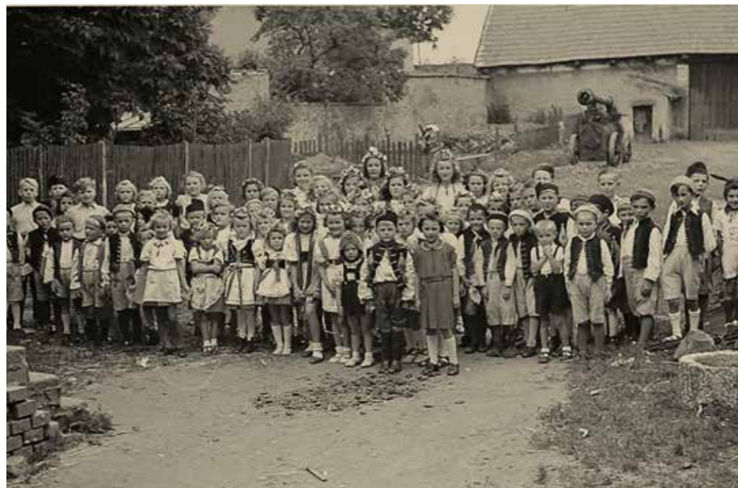
Žactvo obecné školy, rok 1945