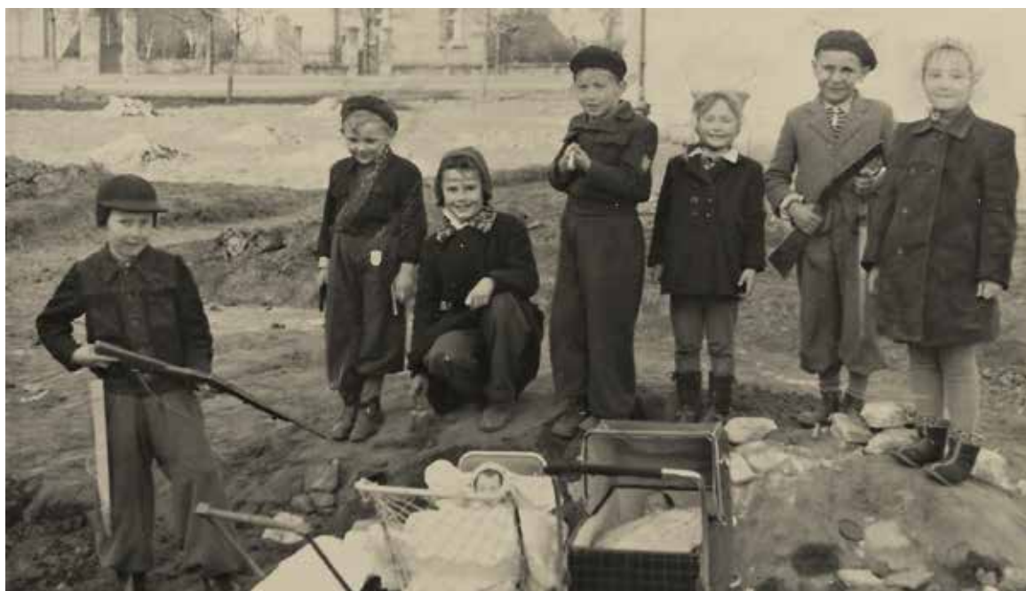
Děti U Párníků si hrají na maminky a partyzány, fotoarchiv M. Šloufové.