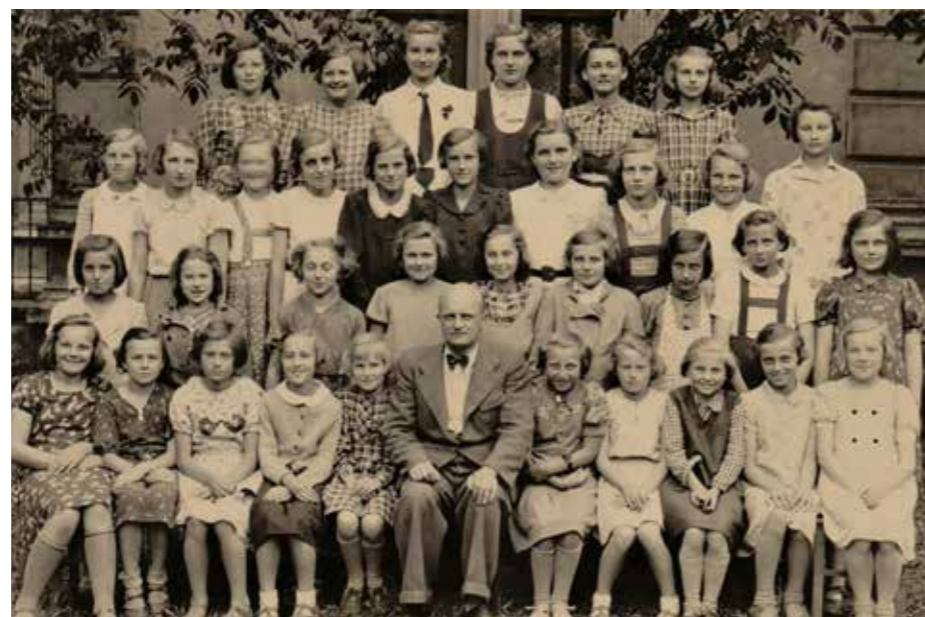
Foto: školní rok 1938-1939

V noci nám často někdo zaklepal na okno, ale strachu jsme neměli. Vždyť jsme ve škole nebyli sami. Konečně jsem se osmělil žádati, aby škola byla ohrazena. Pan starosta mi řekl: „Odměňte si to